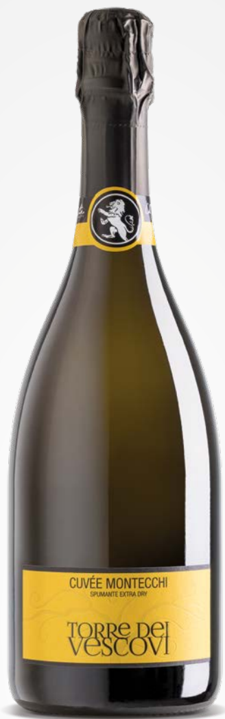
Torre dei Vescovi CUVÉE DEI MONTECCHI SPUMANTE EXTRA DRY 0.75 Lt